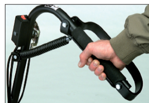
Měkká madla s ocelovým chráničem pro maximální ochranu. Praktické a bezpečné umístění ovládání.