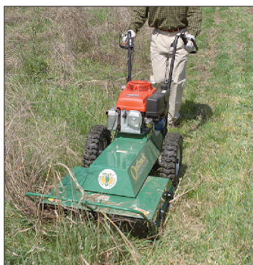
3 rychlosti a zpětný chod