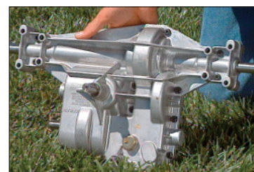
Zesílená náprava kombinující převodovku s diferenciálem je zabezpečena proti zachycení nečistot při práci. Silný pohon na obě velká 40cm kola.

Uvedené fotografie jsou pouze ilustrativní.