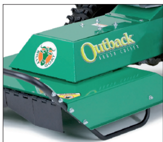
Pevná žací hlava je stabilní i při práci ve velmi nerovném terénu a ve vysoké vegetaci.