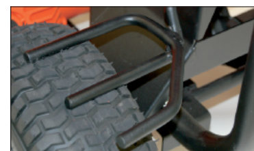
Parkovací brzda obj. č.: 440140, volitelné pro F9, F13, F18