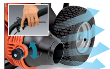
Systém Aim&Shoot™, zajišťitelný ve 3 polohách, umožňuje přesné namíření proudu vzduchu

Uvedené fotografie jsou pouze ilustrativní.