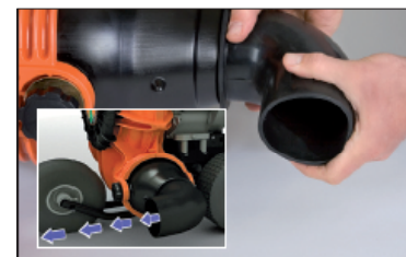
Přední nástavec (standard u F9 a F13, nelze u F18). Pro úklid okolo budov, oplocení, živých plotů. Obj. č.: 441130