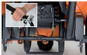
Samochodný pojezd je výhodou při dlouhé práci v náročném terénu. Modely označené SPH.