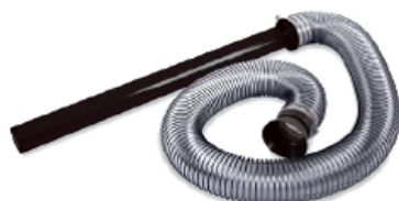
3m hadice (Ø10 cm) vhodná pro těžko dostupná místa. Obj. č.: 441166 (pouze pro F601S)